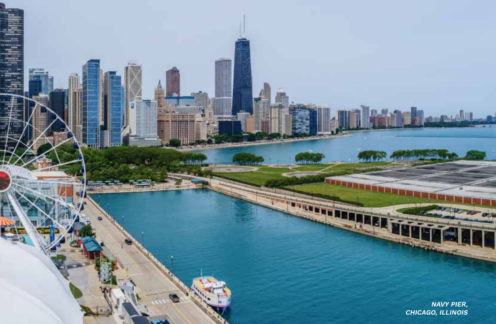
NAVY PIER, CHICAGO, ILLINOIS

In der Region des Lake Superior gibt es eine Fülle von Outdoor-Möglichkeiten: Wandern, Radfahren, Bootfahren, Angeln, Golfen, Kajakfahren, Höhlenerkundungen und Schneemobilfahren. Was auch immer Ihr Lieblingssport oder -hobby ist: Hier können Sie es umsetzen und in vollen Zügen genießen.